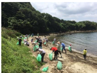
残念ながら、漂着ゴミが絶えることはありません。

夏休み前の休日、各地でイベントも行われている中、多くの方々にご参加頂きました。 海岸清掃に取り組んだ後、カレーのふるまいや、ワークショップの開催など、 参加者同士の親睦を深めながら、活動を行うことが出来ました。