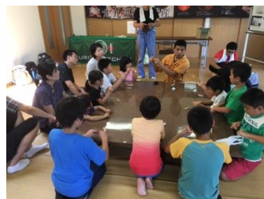
ワークショップも好評でした。