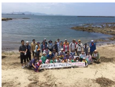
綺麗になった海岸でみんなで記念撮影。