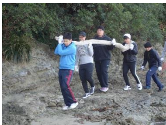
若いパワーで重い流木も軽々？