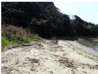
皆さんの力でとっても綺麗になりました。