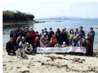
綺麗な景色をバックにみんなで記念撮影！

今回、参加協力頂きました学校・企業・団体・行政様(順不同・敬称略) 市内外地域の皆様、北九州市漁業協同組合馬島支所、北九州市青少年課ボランティアステーション、浅野工芸舎、NPO法人 北九州環浄研、 瑠璃スキッチン、私たちの未来環境プロジェクト、㈱ケイエス企画、ニホン・ドレン㈱福岡営業所、その他