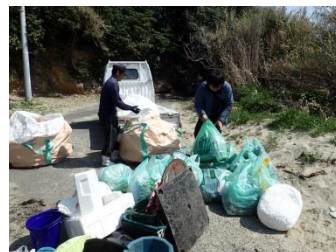
島の人たちも協力して回収したゴミを搬出します。