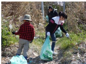
春休みということで、お子さんの参加もありました。