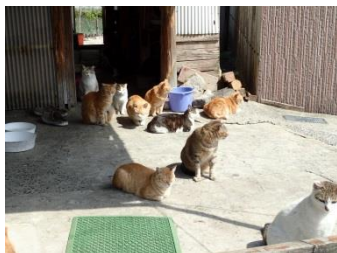
晴天に恵まれ、猫たちの歓迎を受ける？

平成28年度 第4回 馬島清掃団(2017年3月26日実施) 参加者:51名 回収量:426.16kg