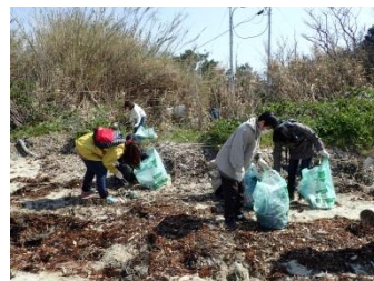
漂着ゴミは相変わらず、プラスチック製品が多いです。