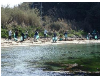
清掃活動スタート。本日も、頑張りましょう！