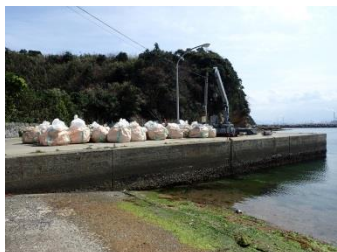
ゴミは港からさらに船で本土へ。島のゴミ問題は大変です。