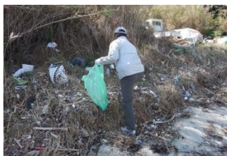
トンクを使い細かいゴミも丁寧に集めます。