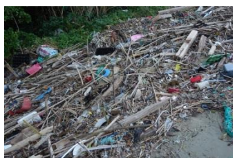
海岸の砂浜は漂着ゴミで一杯です。

平成29年度 第3回 馬島清掃団(2017年11月12日実施) 参加者:14名 回収量:371kg