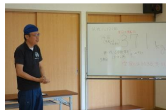
出来る範囲で出来ることを続けて参ります。

今回、参加協力頂きました学校・企業・団体・行政 様(順不同・敬称略) 市内外地域の皆様、北九州市漁業協同組合馬島支所、北九州市青少年課ボランティアステーション、瑠璃スキャッチ、私たちの未来環境プロジェクト、ニホン・ドレ(株)福岡営業所、(有)リフトレスワン、その他