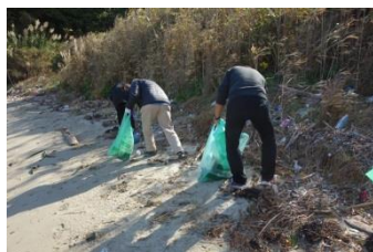
各自ケガに気を付けながらゴミを回収していきます。