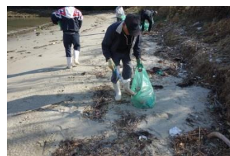
お天気にも恵まれる中、清掃活動スタート!