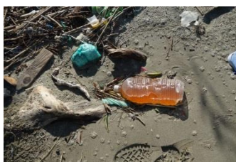
色々な物が流れ着いています。