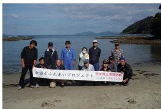
ハイチーズ! 本当にお疲れ様でした。