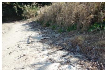
見違えるように綺麗になりました。