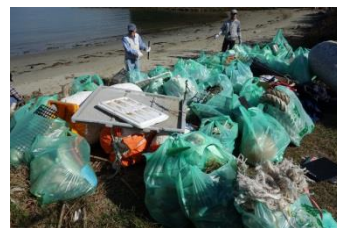
少数精鋭でしたが、多くのゴミを回収しました。